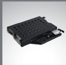
多媒体扩展舱 第二颗附加硬盘 驱动器